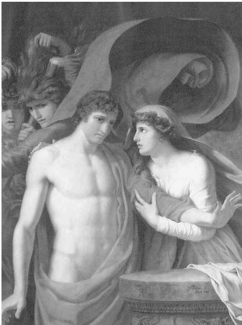
Abb. 1: Orest und Iphigenie / Iphigenie und Orest , 1788