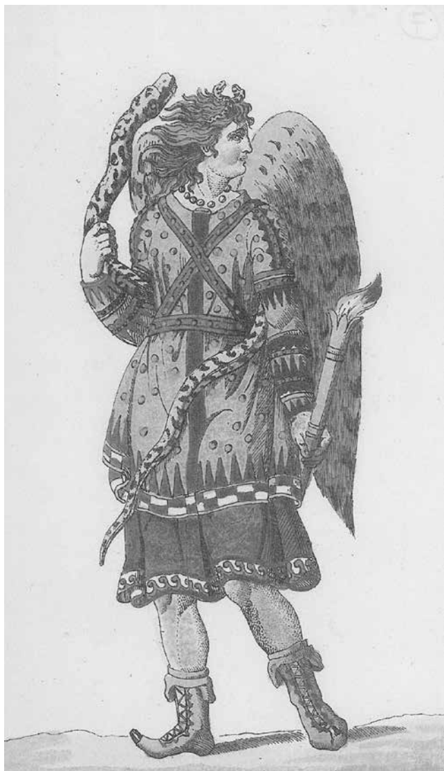
Abb. 7: Furie im späteren attischen Theater, um 1801 Nach einem antiken Vasengemälde der Sammlung Parois von J.H. Meyer (aus: K. A. Böttiger, Die Furiemaske im Trauerspiele und auf den Bildwerken der alten Griechen , Weimar 1801, Tafel II)