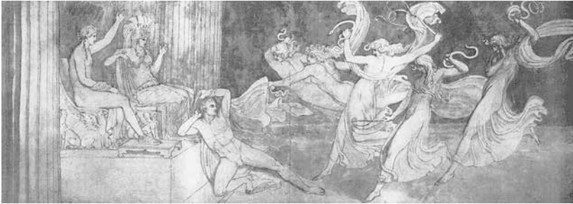
Abb. 3: Orest von den Erinyen verfolgt , 1795/1809