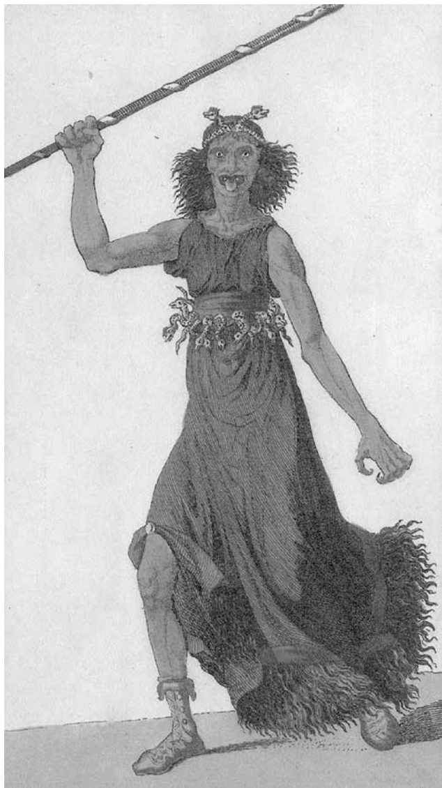
Abb. 6: Furie aus den Eumeniden des Aischylos, um 1801 von J. H. Meyer nach Vorgaben von K.A. Böttiger (aus: K. A. Böttiger, Die Furiemaske im Trauerspiele und auf den Bildwerken der alten Griechen, Weimar 1801, Tafel I )