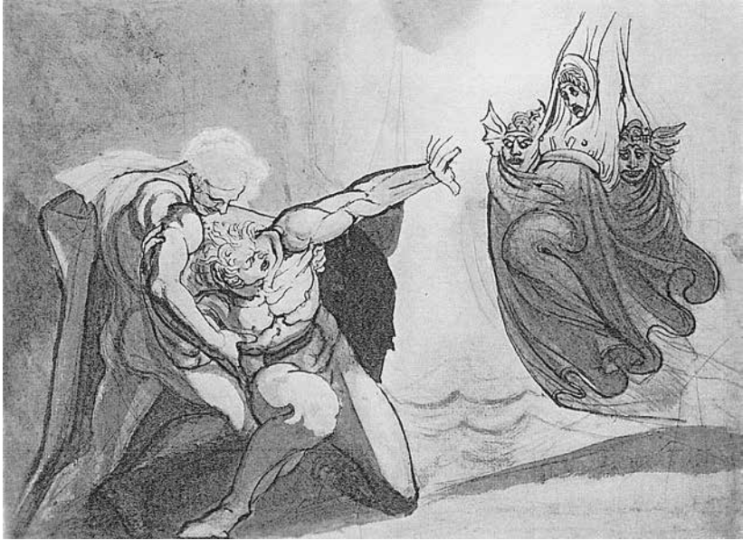
Abb. 4: Die Vision des Orest , um 1800