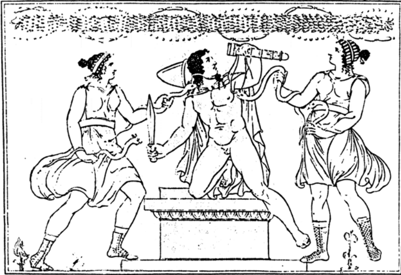
Abb. 8: Orest und die Furien

Nach einem antiken Vasengemälde der Sammlung Hamilton, 1791-95 von J.H.W. Tischbein (aus: K. A. Böttiger, Die Furienmaske im Trauerspiele und auf den Bildwerken der alten Griechen, Weimar 1801, Tafel III)