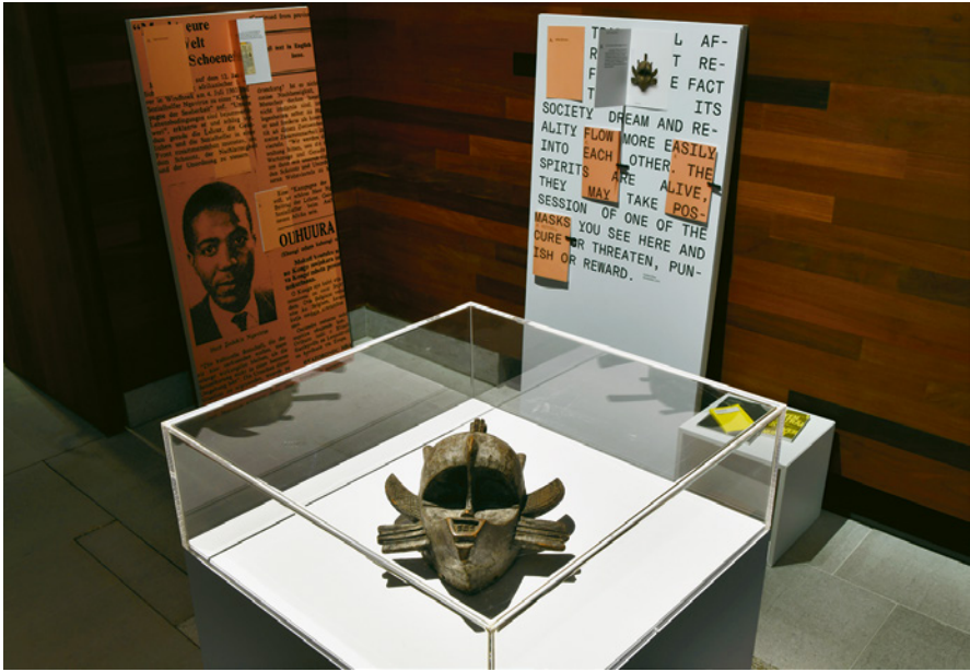
Abb. 5: Narrating Africa (2019–2021): Dekorations-Maske im Stil der ›Kpelie‹-Masken der Senufo aus der Sammlung von Norbert Elias und die dazugehörige Kommentartafel (rechts), © DLA Marbach.

Gastprofessor in Ghana und begann, afrikanische Plastiken zu sammeln. Elias reizte die Ähnlichkeit dieser Masken mit moderner europäischer Kunst und zugleich ihr großer funktionaler Unterschied dazu, wie er in einem Katalog zur Ausstellung seiner Sammlung 1970 erläutert: »Traditional African art reflects the fact that in its society dream and reality flow more easily into each other. The spirits are alive, they may take possession of one of the masks you see here and cure or threaten, punish or reward.« 30 Elias' Sammlung wurde 1994 im DLA photographisch dokumentiert, eine als Souvenir angefertigte Dekorations-Maske im Stil der ›Kpelie‹-Masken der Senufo (ursprünglich bei Begräbnis- und Initiationstänzen eingesetzt) blieb im Bestand, die übrige Sammlung ging in den Kunsthandel. Für die gemeinsam mit der University of Namibia realisierte Ausstellung Narrating Africa (2019–2021) 31 haben wir die Maske neben zahlreichen literarischen Texten vom achtzehnten bis zum