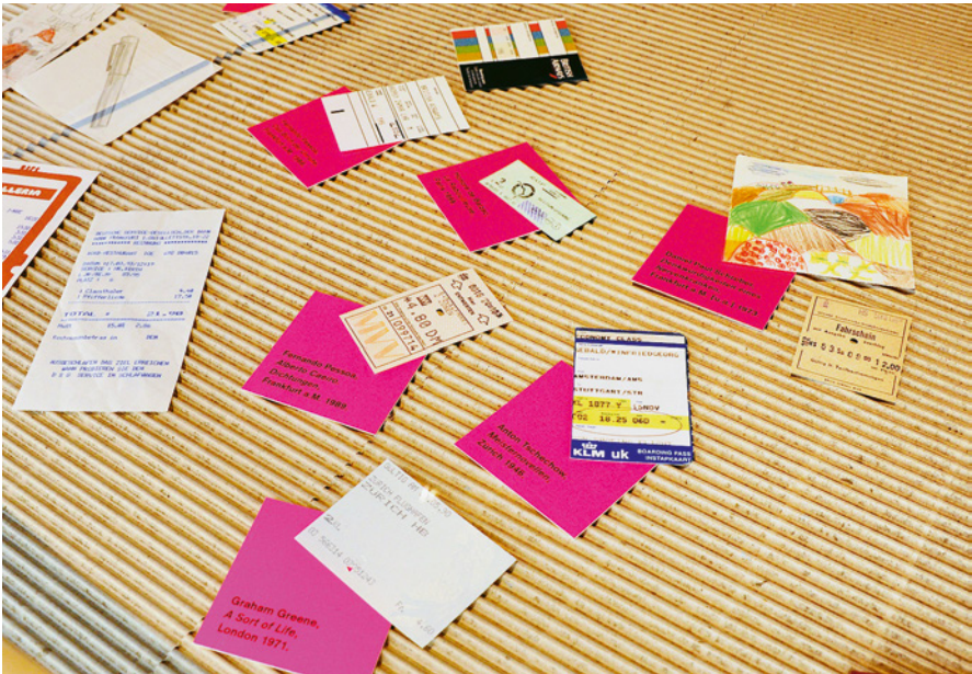
Abb. 4: Das bewegte Buch (2015): einige der Lesezeichen in W.G.Sebalds Bibliothek

beschriftet und geschützt oder (wo konservatorisch unbedenklich möglich) zum In-die-Hand-Nehmen oder (im Fall von zwei eigens für die Ausstellung übernommenen Sammlungen) sogar zum Mitnehmen, als Bibliothekstapete, verlorene Fundsachen, Tauschobjekte, Teile eines Bücherschranks und Rucksackbewohner, als Hülle, Papierlager, Schreibort und Liebesversteck.