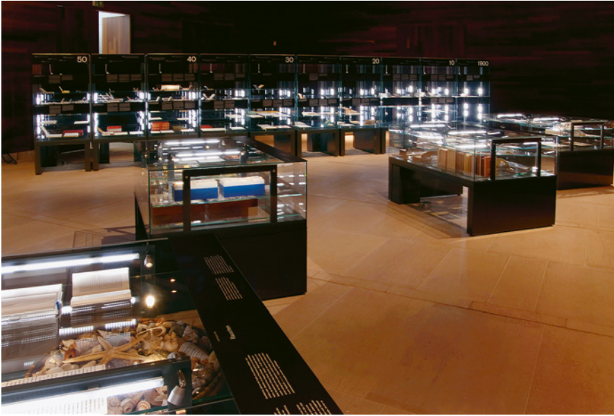
Abb. 3: Materialdeponie und Upcycling, Sammeln und Schreiben: Blick in einen der Ausstellungsräume von Ernst Jünger. Arbeiter am Abgrund (2010)

Deponie der Provenienz, die in der Ausstellung von Tischvitrinen flankiert wurde, in denen sich dieses Prinzip auf Jüngers Schreibtischutensilien, seine Bibliothek und seine Andenkensammlungen ausdehnte.