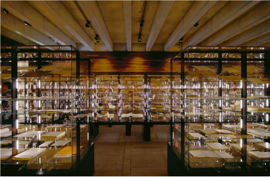
Abb. 1: nexus : Blick auf die »Körper der Literatur« in der ersten Dauerausstellung (2006–2015) im Literaturmuseum der Moderne, © DLA Marbach.

und der Jahreszahl der Entstehung oder Benutzung. Die Nikomachische Ethik von Aristoteles (384–322 v. Chr.) war so aufgeschlagen, dass der Titel und der Bibliotheksstempel »Häftlingsbücherei K.L.-Buchenwald« sichtbar waren, und mit »1945 Adler« beschriftet. 21 Wer mehr wissen wollte, musste im digitalen Museumsguide nachschlagen: