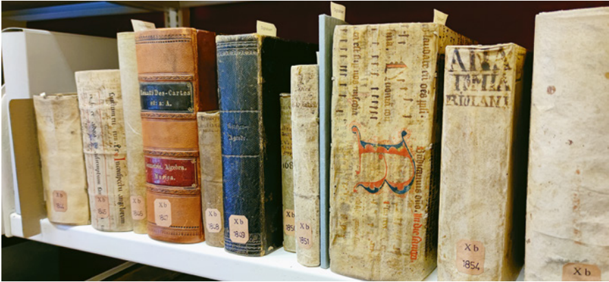
Abb. 1: Individuell gestaltete Einbände beim frühnezeitlichen Buch. Blick auf antiquarische Neuerwerbungen der Herzog August Bibliothek

elle Wertunsicherheit« 24 singulärer Objekte zu konstatieren und ebenso die Einschätzungen der Kunstsoziologie heranzuziehen, welche »die ›Unkalkulierbarkeit‹ als Merkmal des Kunstsystems« statuiert. 25 Gemeint sind hier die nicht vorab berechenbaren Preismargen von Objekten und indirekt auch die nicht vorhersehbaren Handlungen von Akteuren und Akteurinnen auf dem Kunstmarkt.