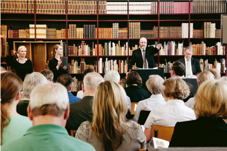
Abb. 2: Bieterszene aus der Auktion Wertvolle Bücher, 21. Mai 2012, Abendauktion, Ketterer Hamburg

nächsten Versteigerung zu schaffen. Im Schaumraum verbinden sich die beiden Bereiche, dort, wo auf dem Podium Auktionator oder Auktionatorin sitzen und an ihrer Seite Personal die Auktionsobjekte im Original präsentiert.