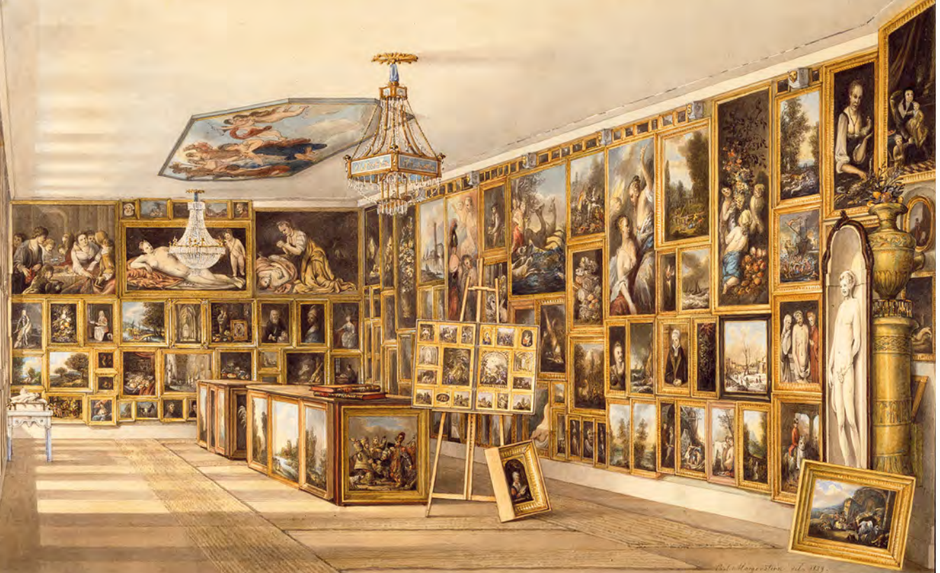
Abb. 6 Carl Morgenstern, Das Gemäldekabinett des Johann Valentin Prehn, Aquarell, Inv. Nr. B 6391829 | Historisches Museum Frankfurt

Im Gegensatz zu den Miniaturenkabinetten verzeichnen die Auftragsbücher Sammlungen weniger ausschnitthaft, aber auch weniger konkret, da die historischen Zuschreibungen nur schlagwortartig sind und keinen visuellen Abgleich ermöglichen. Dies gilt analog für Inventare und Aktionskataloge, wodurch die Zuordnung konkreter Bilder nicht immer zweifelsfrei möglich ist. Durch die enge Verbindung von Kabinetten und Auftragsbüchern können im Fall der Morgensterns die Vorteile beider Quellenarten, die visuelle Evidenz der Miniatur und die schriftliche Provenienzangabe, zusammen erhoben werden.