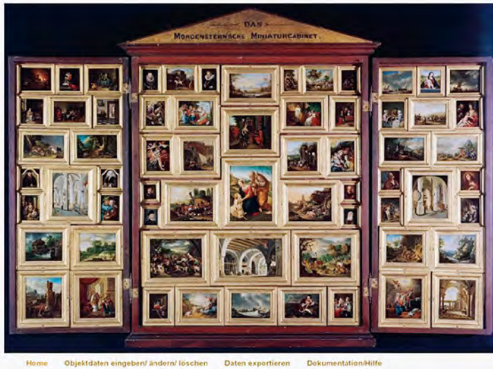
Abb. 7 Datenbank für die Erfassung der Auftragsbücher, Homepage, Historisches Museum Frankfurt

Damit sind Miniaturenkabinette und Auftragsbücher Zeugen einer regional und zeitlich begrenzten Kultur des Sammelns, sie bilden die gesellschaftliche Breite des Kunstsammelns ab sowie die kunstsoziologischen Verhältnisse der Zeit, indem sie über ihre Ersteller auf die übliche Verquickung verschiedener Berufsfelder am Kunstmarkt verweisen.