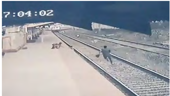
Abb 9: Das Kind einer blinden Frau war 2021 vom Bahnsteig gestürzt und drohte vom ankommenden Zug überrollt zu werden. Mayur Shelke erfasste in Sekunden die Situation und reagierte ohne Rücksicht auf seine eigene Sicherheit. Für diesen grenzüberschreitenden Einsatz, seine blitzschnelle Reaktionsfähigkeit und sein selbstloses Agieren wurde er als Held gefeiert. Dass das Geschehen von einer Kamera aufgezeichnet worden war und über Soziale Medien verbreitet wurde, trug zu Shelkes weltweiter Verehrung bei.

USA weiterhin als Straftat gilt und entsprechend verfolgt würde. Heroische Grenzüberschreitungen lösen insofern nicht selten gesellschaftliche Veränderungsprozesse aus. Vor diesem Hintergrund lassen sich Heroisierungsprozesse auch als Arbeit an gesellschaftlichen Grenzen ( boundary work ) begreifen. Umgekehrt deuten heroische Figuren, wenn sie auftreten, in der Regel auf gesellschaftlichen Wandel hin.