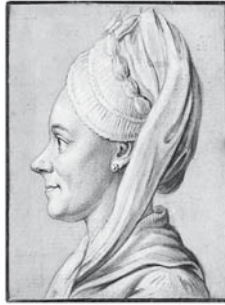
Abb. 5. Sophie von La Roche am 27. Juli 1774.