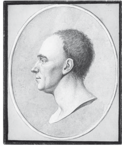
Abb. 14. Johann Bernhard Basedow am 13. Juli 1774.