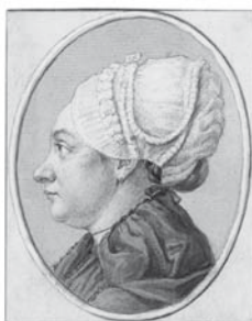
Abb. 8. Katharina Elisabeth Goethe am 25. Juni 1774.