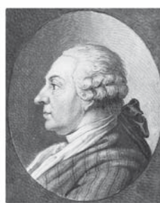
Abb. 9. Johann Caspar Goethe am 26. Juni 1774.

Abb. 23) bemerkte er: »alle kennbar, und doch alle verunedelt oder veraltert. Alle von demselben Zeichner gezeichnet, und aller Augenbraunen zu schwach und zu hoch über den Augen – und daher alle schwächer, weiblicher als die Natur.« 12