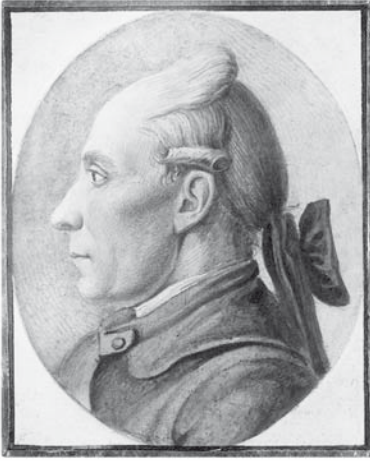
Abb. 13. Johann Konrad Deinet im Juli 1774.