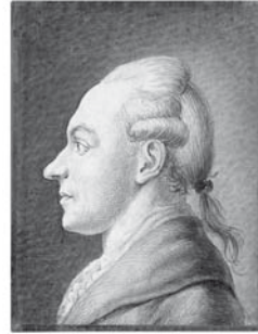
Abb. 19. Johann Heinrich Merck am 3. August 1774.