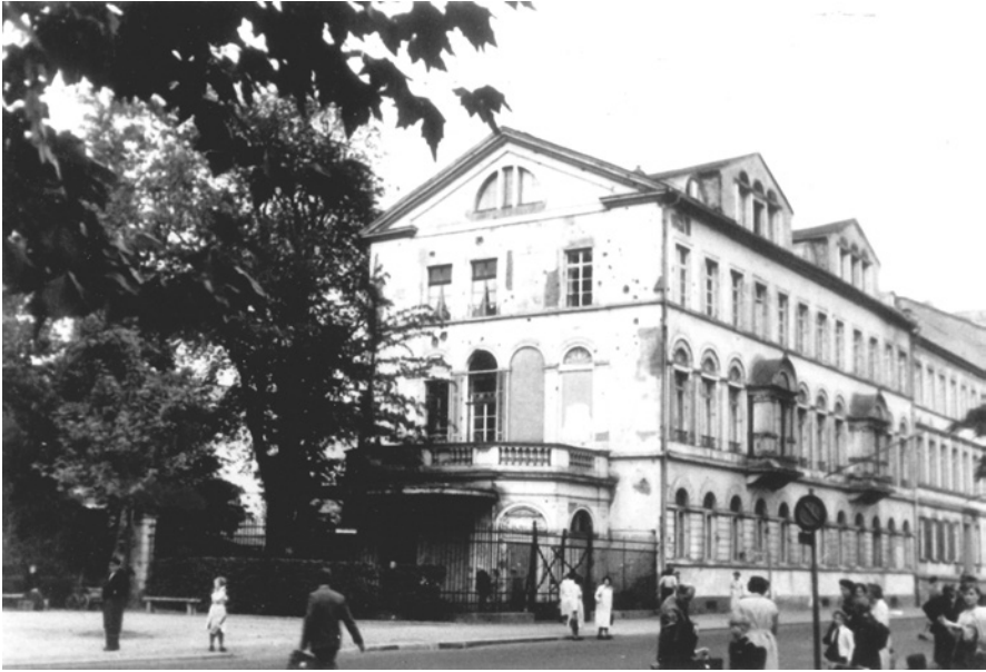
Abb.1 Untermainkai 15 (Rothschild-Palais) etwa 1948.

zialistischer Buchpolitik geblieben waren: Die Nationalsozialisten waren sozialistischen, kommunistischen und vor allem jüdischen Veröffentlichungen in Frankfurt und andernorts zuleibe gerückt, weil man den nonkonformen Büchern selbst in der Diktatur Wirkmacht zutraute. Im offiziellen NS-Jargon schien das jüdische oder NS-kritische Buch imstande, den arischen Volksgeist zu zersetzen und den NS-Staat zu gefährden. Selbst seit Kriegsbeginn und noch parallel zum Genozid setzten die NS-Parteibibliothekare allerdings nicht nur darauf, gehortete jüdische Sammlungen komplett zu vernichten. Stattdessen ließ man beflissene Bibliothekare in den geraubten Buchmassen nach eventuell doch lohnendem »Kulturgut« stöbern. Auch in der Stadt- und Universitätsbibliothek Frankfurt begünstigte das Bereicherungs- und Schacherkreisläufe bibliothekarischer Profiteure, die dort die Raubbestände endgültig zerfledderten. Es sei denn, man schloss Raubgut wie die Judaica und Hebraica in der Rothschild-Bibliothek hochsicherheitstraktartig weg. Als scheute man vor einem numinosen Jüdischen zurück, mit dem man sich im geschützten Separé würde auseinandersetzen müssen, um sein Potenzial zu brechen. 78