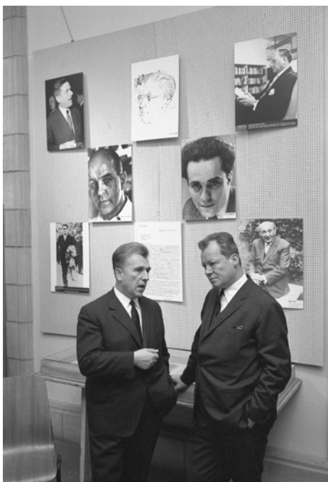
Abb. 7 Exilanten-Tagung in Luxemburg Eröffnung der Ausstellung Exil-Literatur 17.-18.1.1968. Bundesminister des Auswärtigen Willy Brandt (re.) mit dem luxemburgischen Minister für Auswärtiges, Armee und Kultur Pierre Grégoire

Deutschen reflektierte Blicke auf ihre jüngste Vergangenheit erwartete, lag nahe. 173 Die Frankfurter Exilliteraturausstellung schien sich als verständigungs-politisches Exportgut anzubieten.