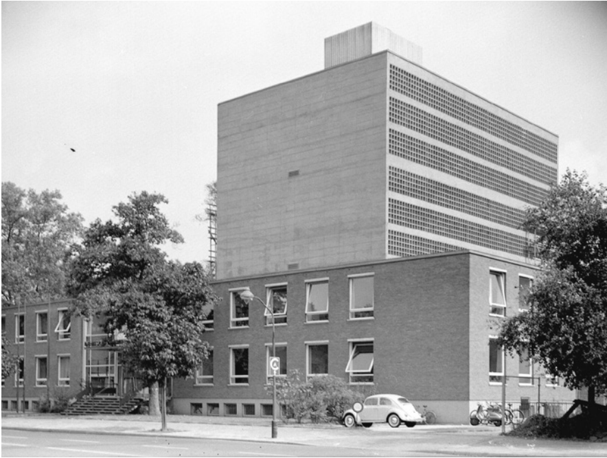
Abb. 5 Deutsche Bibliothek Frankfurt a.M. in der Zeppelinallee 4-8, die drei oberen Geschosse im Rohbau, 1959 nach dem Umzug

der Republik, die in Bonn am Rhein seit 1949 unter dem Vorbehalt der ungelösten Hauptstadtfrage entstanden. Dort sollte die Anwartschaft auf Berlin als Kapitale eines geeinten Deutschland immer mitschwingen. 101