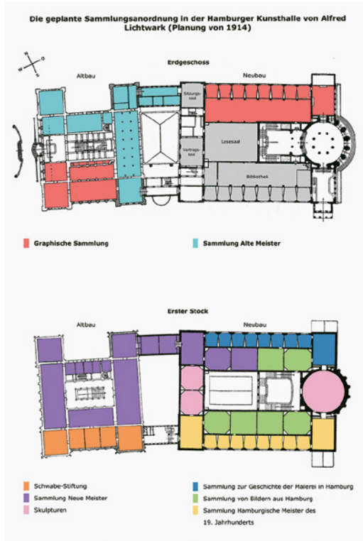
Abb. 2: Die geplante Sammlungsanordnung in der Hamburger Kunsthalle von Alfred Lichtwark (Planung von 1914)

gab es einen Übergang von der Sammlung der Hamburgischen Malerei des 19. Jahrhunderts zur Sammlung der Neuen Meister. Durch die geplante räumliche Trennung der Oberlichtsäle und Kabinette wären aber auch hier keine Sichtbezüge zwischen den Abteilungen entstanden. Die räumliche Vernetzung der Sammlungen wäre damit aufgehoben gewesen.