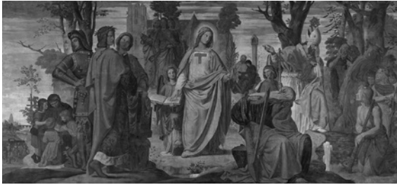
Abb. 3: Philipp Veit: Die Einführung der Künste in Deutschland durch das Christentum (1836)

Den inneren Zusammenhang des Christlichen und Germanischen hat etwa auch Philipp Veit in seiner »Einführung der Künste in Deutschland durch das Christentum«