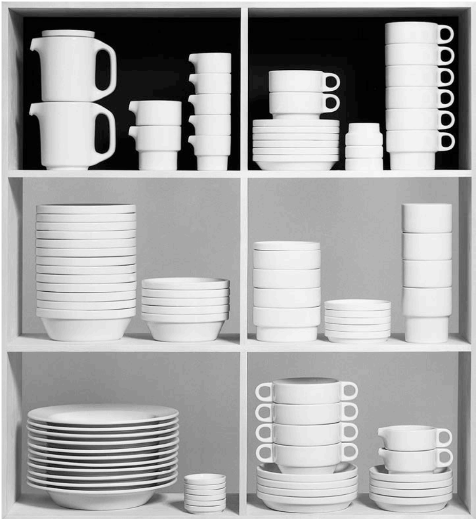
Quelle 1: Hans (Nick) Roericht: Stapelgeschirr TC100, 1959. Hochschule für Gestaltung, Abteilung Produktgestaltung, Diplom. Entwurf: Hans (Nick) Roericht, Datierung: 1959. Inv. Nr. HfG-Archiv 61.0324.