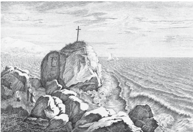
Abb. 8. Ludwig Emil Grimm: Kreuz bei Terracina, 1816, Radierung, 16 × 23,4 cm, Klassik Stiftung Weimar, Kunstsammlungen.