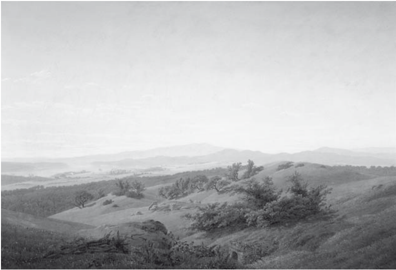
Abb. 3. Caspar David Friedrich, Böhmische Landschaft mit See, 1810, Öl auf Leinwand, 68,5 × 102 cm, Klassik Stiftung Weimar, Kunstsammlungen, Inv. G 35a.