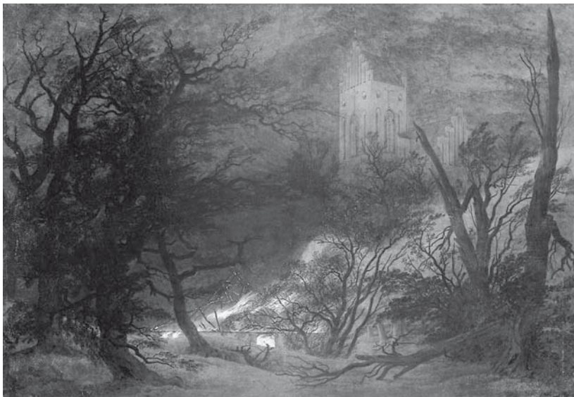
Abb. 4. Caspar David Friedrich: Nachtlandschaft mit Waldbrand (Brennendes Haus und gotische Kirche), 1810, Öl auf Leinwand, 61 × 88,2 cm, Museum Georg Schäfer, Schweinfurt.