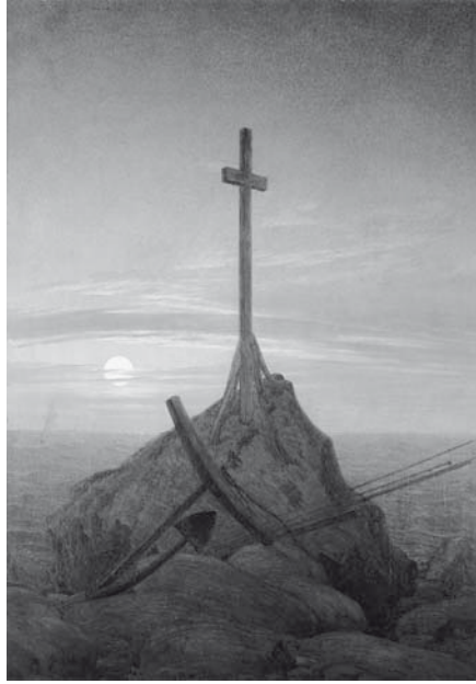
Abb. 7. Caspar David Friedrich: Kreuz an der Ostsee, 1815, Öl auf Leinwand, 45 × 33,5 cm, Berlin, Schloss Charlottenburg.