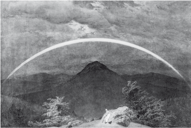
Abb. 5. Caspar David Friedrich: Gebirgslandschaft mit Wanderer und Regenbogen (sog. ›Landschaft mit dem Mondregenbogen‹), 1810, Öl auf Leinwand, 70 × 102 cm, Museum Folkwang, Essen.