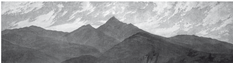
Abb. 6. Caspar David Friedrich: Mond über dem Riesengebirge (Bergkette mit Mond), 1810/1811, Öl auf Leinwand, 47,5 × 167 cm, Fragment, ursprüngliches Format ca. 110 × 170 cm, Klassik Stiftung Weimar, Kunstsammlungen.