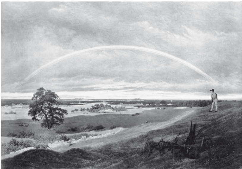
Abb. 2. Caspar David Friedrich, Landschaft mit Regenbogen (nach ›Schäfers Klagelied‹ von Goethe), 1810, Öl auf Leinwand, 59×84,5 cm, ehemals Kunstsammlungen Weimar, seit 1945 verschollen. Abbildung nach einem Lichtdruck, Klassik Stiftung Weimar.