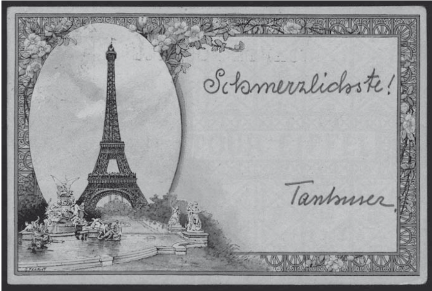
Abb. 6: Postkarte von Arno Holz aus Paris, April 1891

darin eine Variante von »Herzlichste Grüße« sehen, die gleichzeitig so etwas wie »Schmerzlichste Erinnerungen« bedeutet?