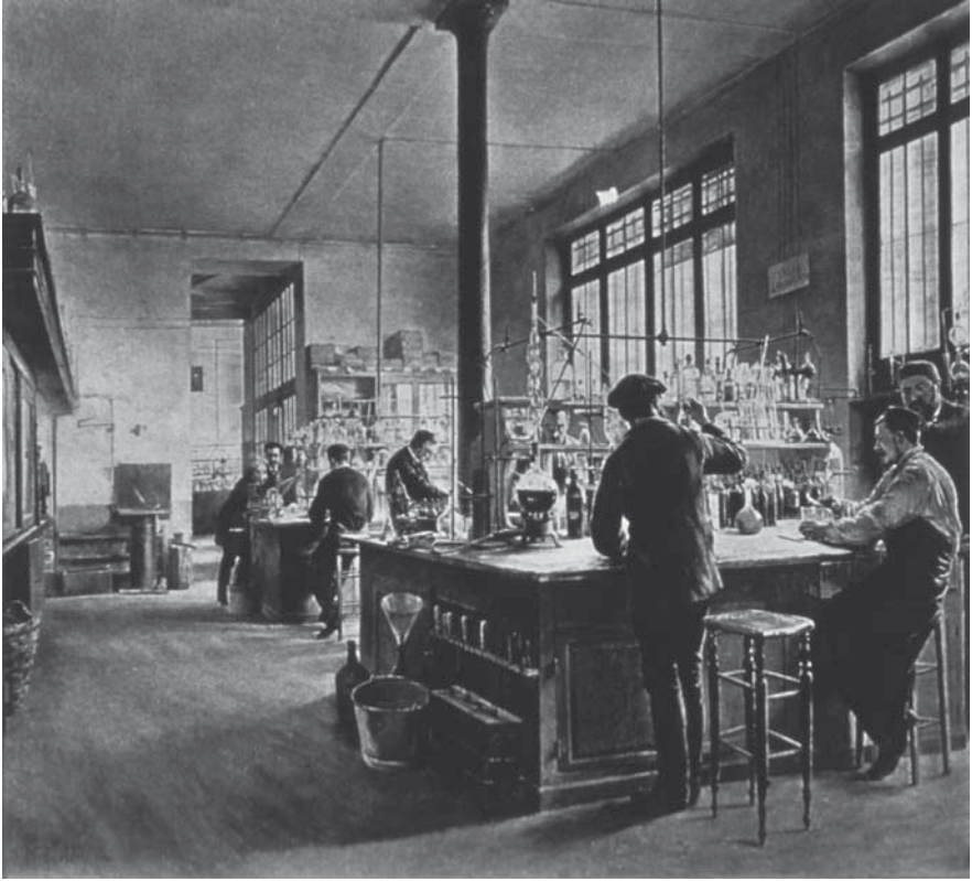
Abb. 4: Ferdinand Joseph Gueldry, Das städtische Chemielabor. Musée Carnavalet, Paris

hindert diesen Kritiker nicht daran, der deutschen – erst recht aber der norwegischen 59 – Malerei den Vorzug zu geben. So erscheint ihm die Farbbehandlung der ausgestellten Gemälde leicht künstlich. Nachdem er zunächst fast erleichtert festgestellt hat, dass auch die französischen Maler das Meer nur blau und einen Baum nur grün malen können, bemerkt er: