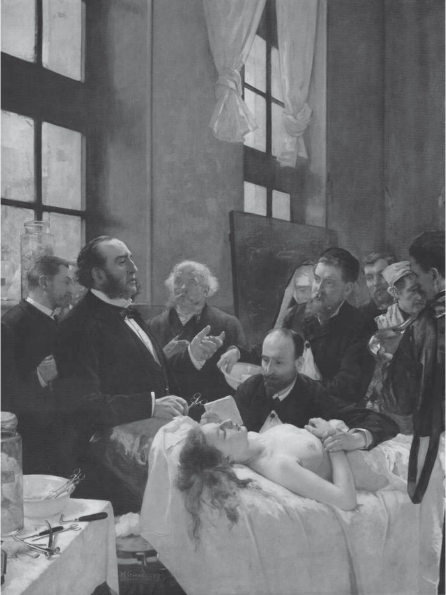
Abb. 3: Henri Gervex, Vor der Operation. Musée d'Orsay, Paris